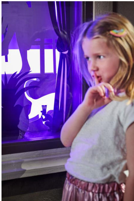
Kinderen vinden meestal als eersten le Petit Chocolatier

Om de nieuwe bewoner van Chocolate Nation alle eer te geven die hij verdient, ontwikkelde onze chocolatiers een speciaal chocoladedessert waar le Petit Chocolatier de hoofdrol in speelt. -"Het dessert bestaat uit verschillende chocoladetoetsen verpakt in een chocolade omhulsel. De gast mag dat omhulsel met zijn lepel zelf kapot slaan om bij al het lekkers te geraken." De chocolade van het dessert wordt door de chocolatiers gemaakt in de bean-to-bar van Chocolate Nation en wordt geserveerd in het naastgelegen restaurant Octave, het enige restaurant ter wereld dat over een eigen bean-to-bar beschikt. De lekkernij kan besteld worden als dessert na een lunch of diner, maar er kan ook overdag van gesmuld worden met een kop koffie of huisgemaakte warme chocolademelk. Volgens Stuyck is het dessert niet alleen bij kinderen populair. En wie de smaak van Belgische chocolade kent, zal dat begrijpen.