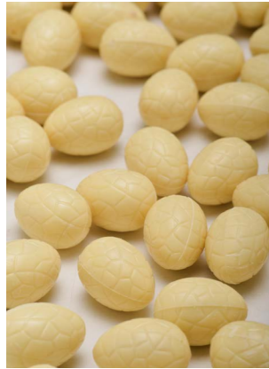
WITTE CHOCOLADE met knettersuiker

EI, EI, EI EN WE ZIJN ZO BLIJ, WANT HET IS BIJNA PASEN EN DAT VIENEN WIJ!