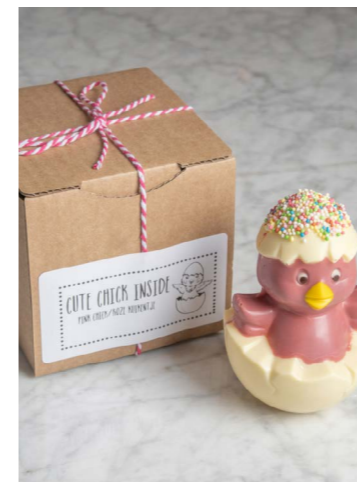
RUBY & WITTE CHOCOLADE MET DISCODIP HOEDJE

HOI! HIER BEN IK DAN, LIJKT DIT KUIKENTJE TE ZEGGEN. DAAR WORD JE TOCH IN EEN KLAP VROLIJK VAN?! WE KUNNEN JE VERZEKEREN DAT DE SMAAK VAN DEZE AMBACHTELIJK GEMAAKTE KUIKENTJES JE OOK VROLIJK MAAKT.