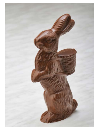
MELK CHOCOLADE HAAS LENGTE: 23 CM