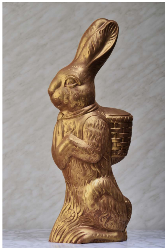
MELK CHOCOLADE MET GOUDEN COATING LENGTE: 64 CM

JE WAANT JE NET ALICE IN WONDERLAND MET DEZE PAASHAAS VAN RUIM EEN HALVE METER HOOG MET EEN LAAGJE EETBAAR GOUDPOEDER.