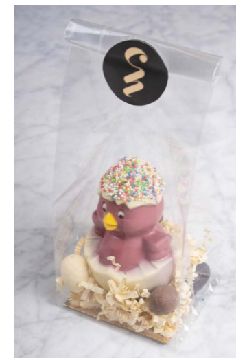
RUBY & WITTE CHOCOLADE MET DISCODIP HOEDJE EN 6 GEVULDE EITJES

DIT SCHATTIGE CHOCOLADE KUIKENTJE PIEPT NET ZIJN EI UIT. HET TOVERT EEN GLIMLACH OP JE GEZICHT. NET ALS DE GEVULDE CHOCOLADE EITJES, ZODRA ZE JE MOND RAKEN.