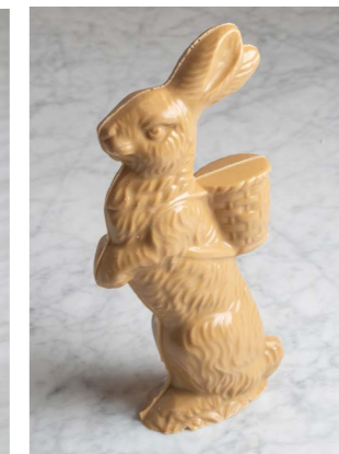
GOLD CHOCOLADE HAAS LENGTE: 23 CM