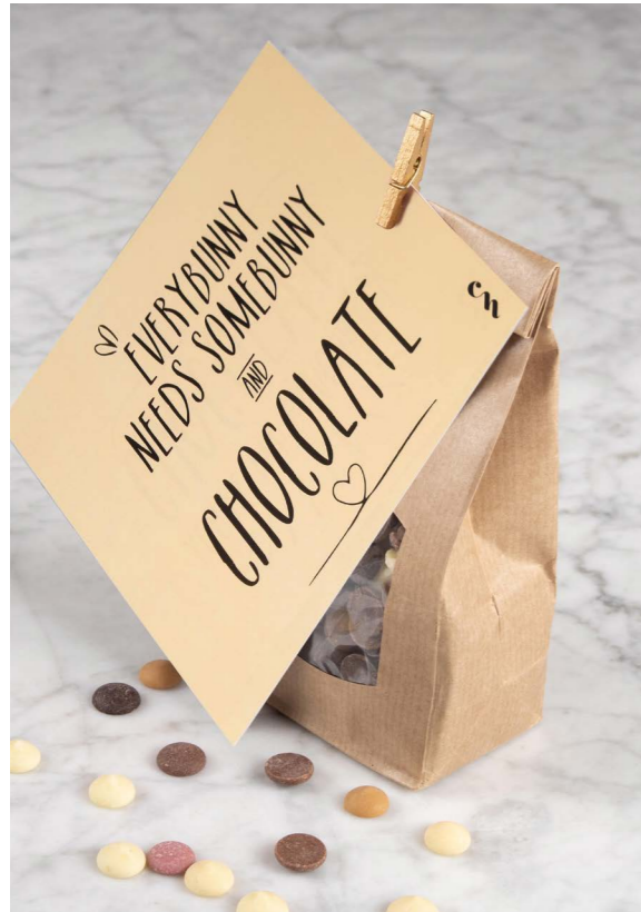
10 SOORTEN CHOCOLADE + WENSKAART

EEN ZAKJE GEVULD MET 200 GRAM CONFETTI CALLETS IN 10 VERSCHILLENDE SMAKEN. EEN ECHT FEESTJE! + WENSKAART MET EEN VROLIJKE PAAS QUOTE.