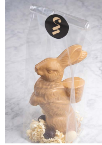
GOLD CHOCOLADE MET 6 GEVULDE EITJES