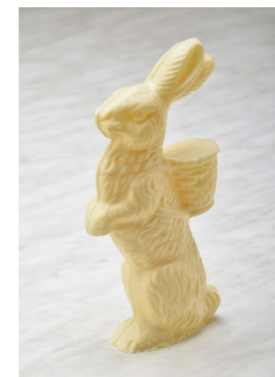
WITTE CHOCOLADE HAAS LENGTE: 23 CM