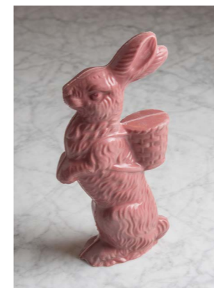
RUBY CHOCOLADE HAAS LENGTE: 23 CM

DEZE PAASHAZEN ZULLEN ELKE ONTBIJT/BRUNCHTAFEL OPVROLIJKEN, EN ZE ZIJN NOG LEKKER OOK!