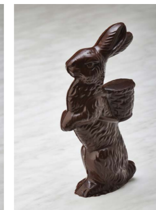
PURE CHOCOLADE HAAS LENGTE: 23 CM