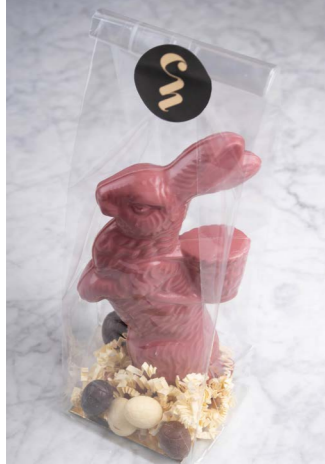
RUBY CHOCOLADE MET 6 GEVULDE EITJES

DEZE AMBACHTELIJKE CHOCOLADEPAASHAZEN GEMAAKT UIT 100% BELGISCHE CHOCOLADE ZULLEN PRACHTIG STAAN OP ELKE PAASONTBIJT OF BRUNCHTAFEL. EN WAT EEN GELUK; ER ZIJN EEN PAAR OVERHEERLIJK GEVULDE EITJES UIT ZIJN MANDJE GEVALLEN.