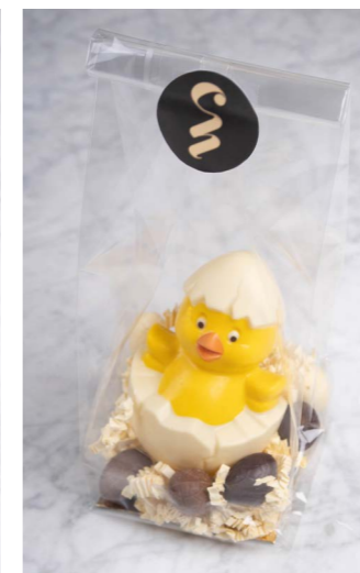
WITTE CHOCOLADE MET 6 GEVULDE EITJES