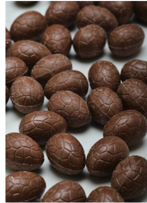
MELK CHOCOLADE met limoen karamel