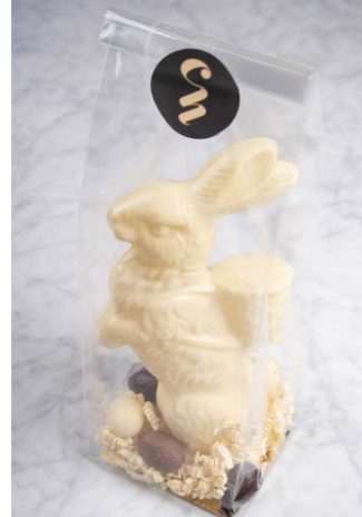
WITTE CHOCOLADE MET 6 GEVULDE EITJES