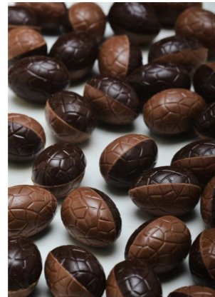
MELK & PURE CHOCOLADE Gianduja met feuilletine