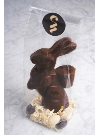
PURE CHOCOLADE MET 6 GEVULDE EITJES