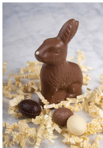
MELK CHOCOLADE MET 3 GEVULDE EITJES