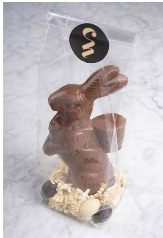
MELK CHOCOLADE MET 6 GEVULDE EITJES